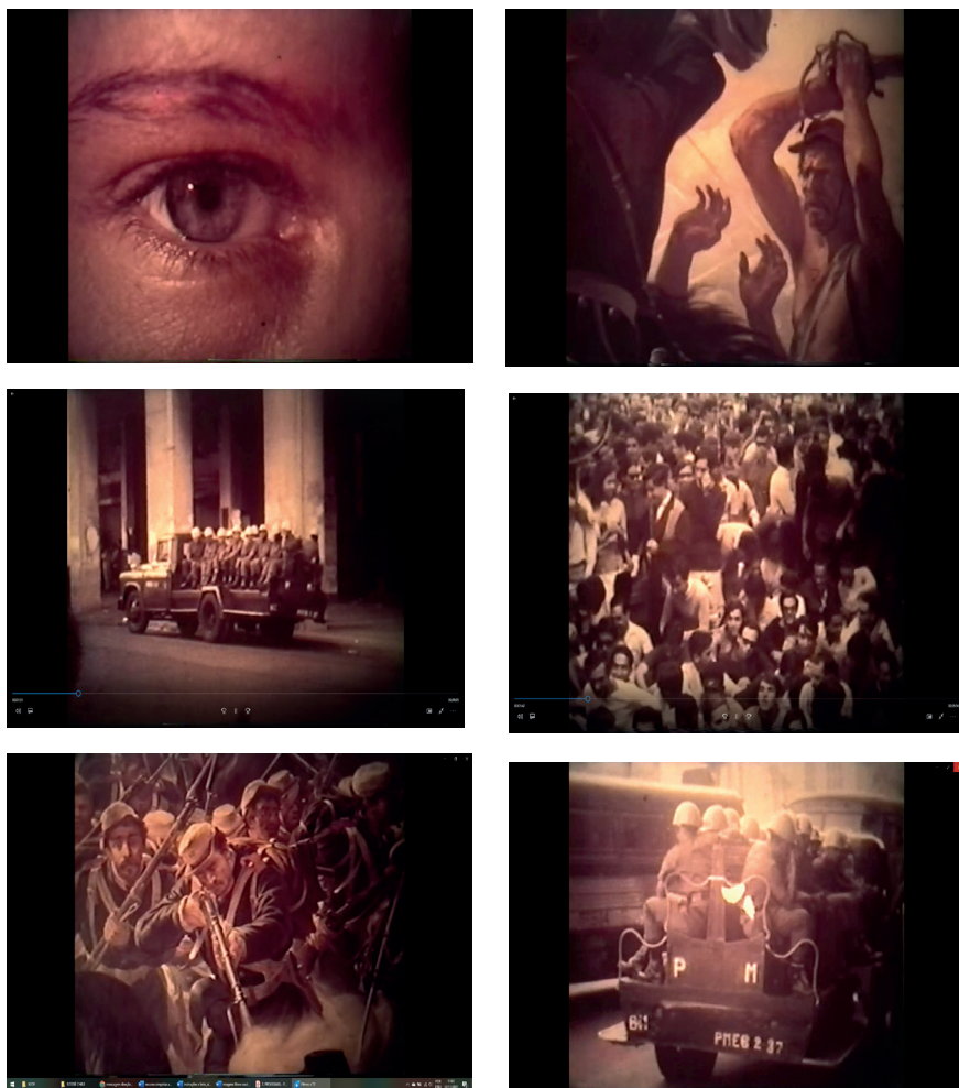
Fig. 1. Fotogramas do início do primeiro bloco narrativo do curta-metragem Cildo Meireles (Wilson Coutinho, 1979)

hora, zero minuto, zero segundo”. Trata-se, já, da inserção de um fragmento de obra do Cildo Meireles, o LP Sal sem carne , uma “escultura sonora” com 50 minutos de duração produzida pelo artista em 1975.