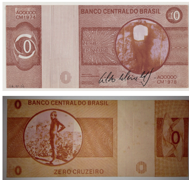
Fig. 6. Cildo Meireles, Nota de Zero Cruzeiro , 1974-1978.

Vê-se, nesse momento, o processo de engarrafamento da Coca-Cola, no interior de uma fábrica, enquanto John Wayne declara, com uma entonação dramática: “Eu me identifico muito com esse trabalho artístico, pois eu também sou um produto da indústria do cinema. As garrafas circulam, giram, andam pelas cidades, e retornam vazias, solitárias, ao mundo asfíxiante das fábricas”. A obra produz uma visibilidade irônica sobre essa prática de consumo, devido a