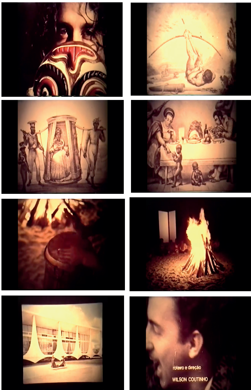
Fig. 7. Imagens do último bloco narrativo em Cildo Meireles (Wilson Coutinho, 1979).