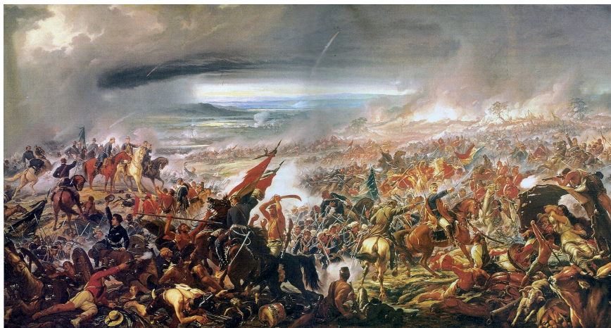
Fig. 2. Pedro Américo. Batalha do Avaí . Pintura a óleo realizada entre 1872 e 1877, em Florença. Acervo MNBA.

“O que resta fazer são novas construções de imagens”, diz a narradora, para então apresentar o artista Cildo Meireles como alguém que, segundo ela, “constrói essas imagens”. Os elementos sonoros aprofundam a lógica de sobreposição temporal. Enquanto a câmera filma galinhas mortas num abatedouro, a voz situa: “1970. Tempo dos Médicis”. Remete, assim, à família dos Médici, os mecenas que governaram Florença no chamado renascimento italiano, apondo-os ao General Emílio Garrastazu Médici, que presidiu o Brasil nos anos mais violentos da ditadura militar.